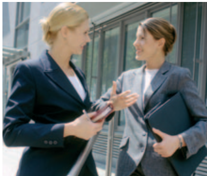
Der feine Sprach-Unterschied: Frauen bewerben sich anders

Eine Studie an der Universität Passau stellt fest: Frauen verkaufen sich in einem Bewerbungsgespräch schlechter als Männer. Schuld daran sind die geschlechtsspezifischen Unterschiede in der Sprache