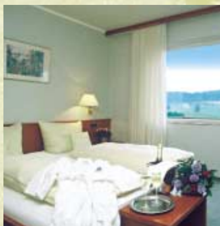
40 Betten in komfortablen Zimmern

Lassen Sie sich Lassen Sie sich einfach einfach mal verwöhnen mal verwöhnen