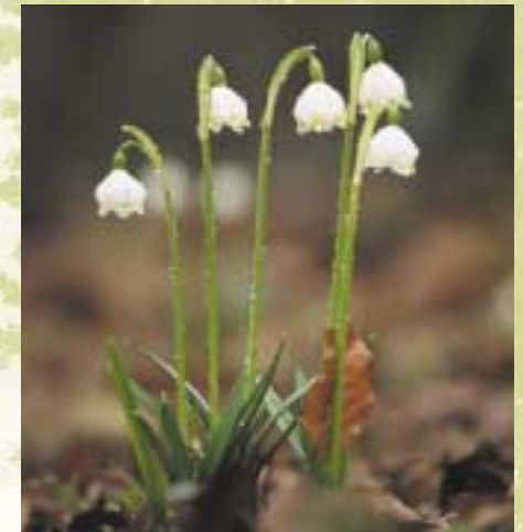
Die Reize der Natur unmittelbar erleben