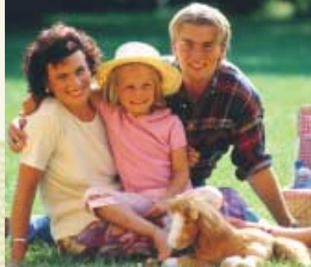
Sommerspaß: Ein Picknick im Grünen