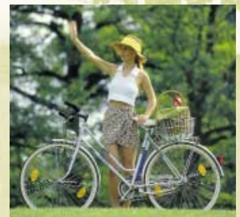
Rad fahren nach Lust und Laune