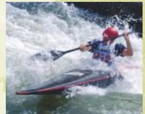
Kanuwandern auf der Lahn