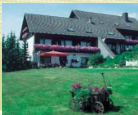
Landhaus Höhler, eine Oase der Ruhe