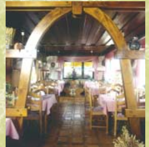
Saisonale Küche im Hotelrestaurant