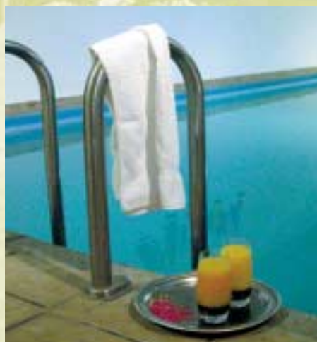
Ganz bequem: Schwimmbad im Haus