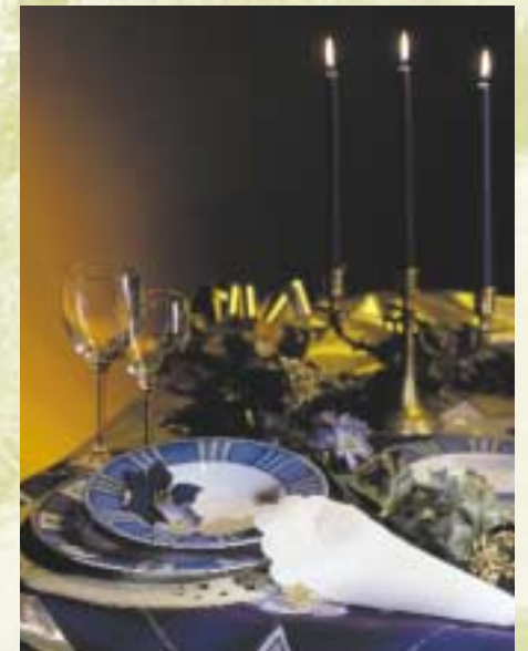
Auch große Gesellschaften sind willkommen