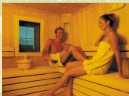
Wohltuende Stunden in der Sauna