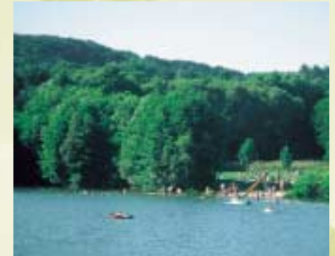
Badesee für Wasseratten